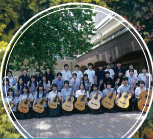
北杜高校 ギター部