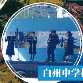
白州中学校 吹奏学部